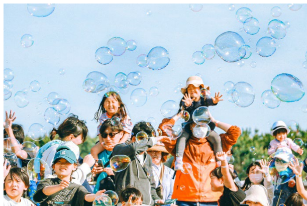
イベントイメージ