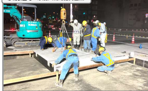
軌道のコンクリートブロックを設置しています