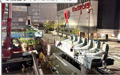
桁の搬入作業を行っています