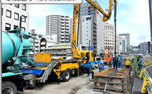
稲荷町の停留場を新設しています

交差点部は夜間に車線規制等を行い、軌道ブロックとレールを敷設しています。稲荷町交差点北側では長さ60mを超える停留場の基礎工事を行いました。 今後も交通規制や騒音等でご迷惑をお掛けしますが、ご協力の程よろしくお願いたします。