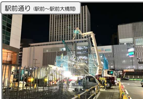
擁壁(構造物)のコンクリート打設を行っています