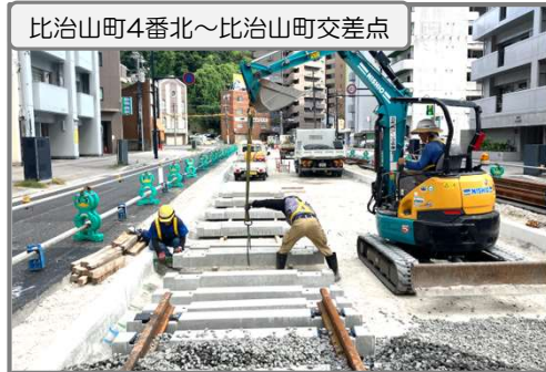
軌道の新設作業を行っています