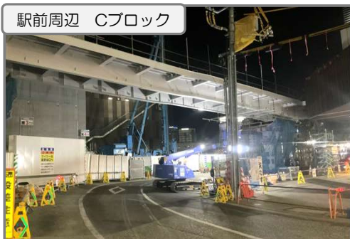
橋桁の足場を解体し、手摺等を整備していきます