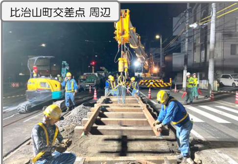
軌道の新設(分岐部)の準備作業を行っています

駅前大橋では桁架設作業が終盤に差し掛かっています。今後、高さ調整及び電車設備・高欄等の整備を順次行っていきます。 今後交通規制や騒音等でご迷惑をお掛けしますが、ご協力の程よろしくお願いたします。