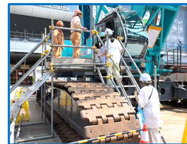
クレーン車の操縦席に試乗し、現場の雰囲気を感じてもらいました。