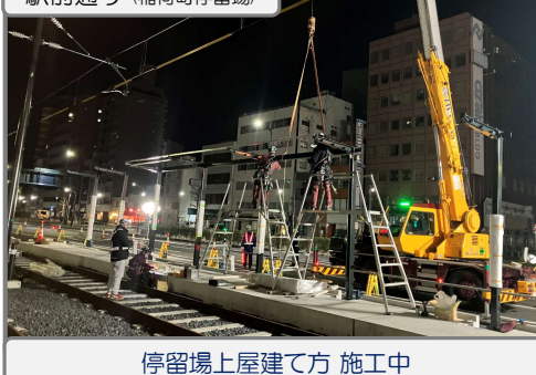
停留場上屋建て方 施工中

広島駅ホーム内では、電車設備・ホーム部の整備を行っています。 今後も交通規制や騒音等でご迷惑をお掛けしますが、ご協力の程よろしくお願ひいたします。