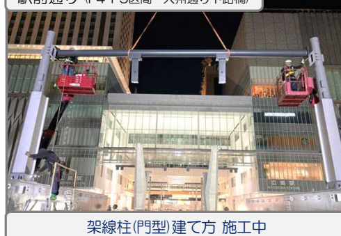
架線柱(門型)建て方 施工中